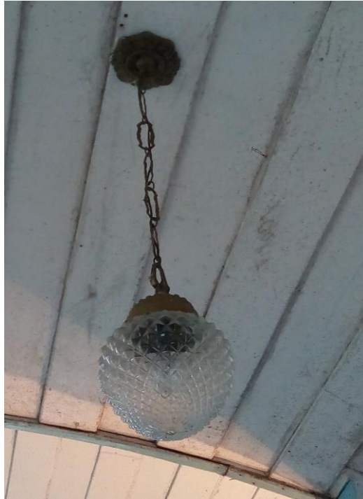
Figura 3 - Luminária para reaproveitamento.