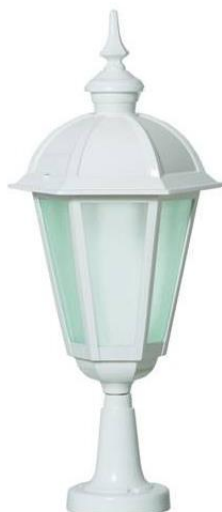
Figura 7 - Referência de luminária sextavada redonda para poste colonial.