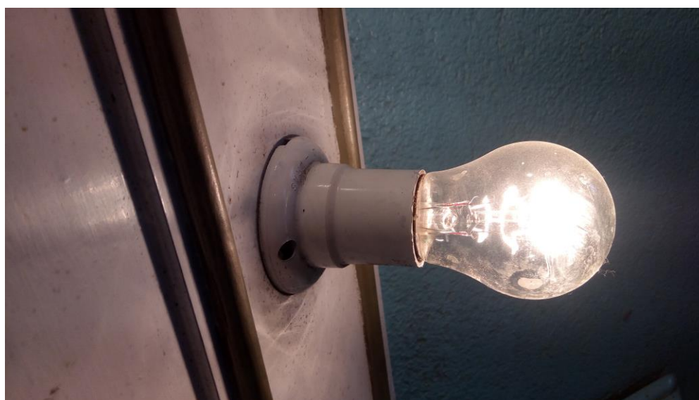
Figura 2 - Receptáculo para iluminação dos nichos.

A iluminação do interior da Capela foi projetada de modo a manter as mesmas configurações da edificação original. Para tanto, serão reaproveitadas as luminárias existentes, bem como os receptáculos dispostos para os nichos de destaque das imagens sacras, conforme mostrado pela Figura 2, Figura 3, Figura 4 e Figura 5. Cabe a empresa responsável pela obra realizar a restauração dos materiais, o que inclui retirada, limpeza, aplicação de anticorrosivo, repintura e reinstalação. Todas as lâmpadas serão substituídas por novas.