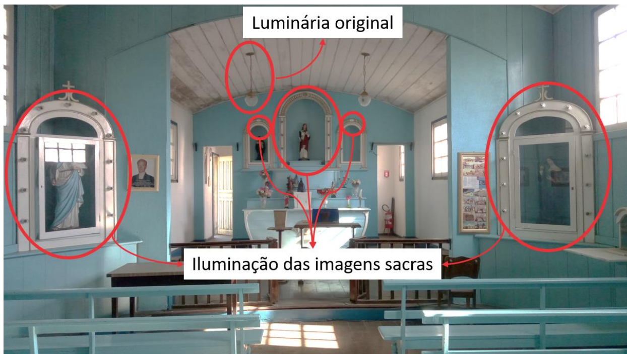
Figura 5 - Visão geral da iluminação interna da Capela São Pedro.

As lâmpadas e luminárias utilizadas no ambiente interno da Capela são as seguintes: