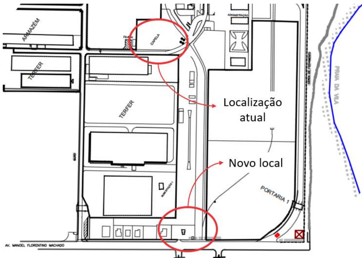
Figura 1 – Deslocamento da Capela São Pedro.

A edificação será deslocada das proximidades do prédio da Engenharia para a margem da Rua Manoel Florentino Machado, locada entre a Portaria 1 e a Portaria 2, conforme pode ser observado pela Figura 1.