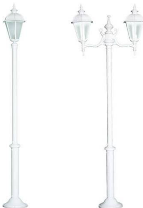
Figura 6 - Referência de poste colonial, de uma e duas pétalas.