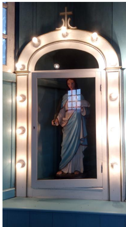
Figura 4 - Iluminação de nicho para imagem sacra.